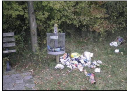
Wer soll sich an einem solchen Rastplatz noch wohl fühlen?