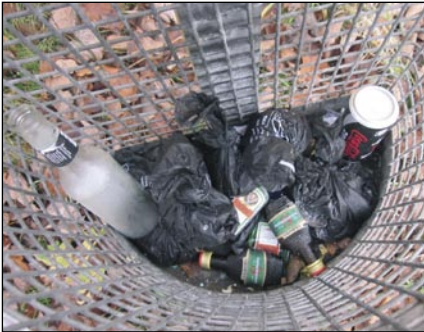
Schnapsfläschchen und Beutel mit Hundekot: Beides gehört nicht in denn Abfallkorb am Rastplatz.

Verursacher dieses Unfugs sind vermutlich Jugendliche. Die Gemeinde richtet an sie eine dringende Mahnung, solche Entgleisungen abzustellen und die Landschaft sauber zu halten. Dies gilt im Übrigen auch für Bereiche entlang von Straßen und Wegen. Appellieren dürfen wir auch an die Eltern, ihre Kinder und Jugendlichen darauf anzusprechen.