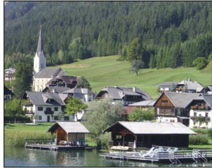
Am Weißensee in Kärnten.

Für die Rückfahrt über das nahezu unberührte Lesachtal war teilweise eine Meis-