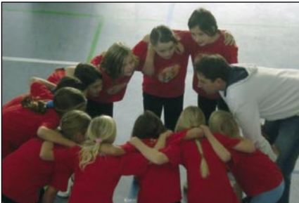
Letzte Instruktionen vor Spielbeginn