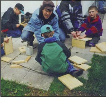
Die Vereinsjugend übt sich im Bau von Nistkästen.