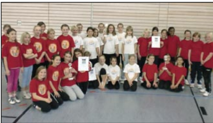
Siegerehrung: Die Vilgertshofer Grundschülerinnen (links) mit den erstplatzierten Schülerinnen aus Landsberg (Mitte) und dem zweitplatzierten Team aus Kaufering.

Die Viertklässlerinnen der Grundschule Vilgertshofen erkämpften sich erfolgreich den dritten Platz beim „Ball über die Schnur“-Grundschulturnier der Mädchen.