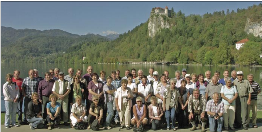
Die Ausflügler am Bleder See in Slowenien.

Miesbach passiert hatten, machten wir an einer Raststätte erst einmal Brotzeit. Gut gestärkt ging es über Kitzbühel und Felbertauern nach Lienz, der Bezirkshauptstadt Osttirols. Bei traumhaft schönem Wetter genossen wir unseren zweistündigen Aufenthalt. Nächster Programmpunkt war eine Schifffahrt auf dem Weißensee, der mit 930 Meter über N.N. als höchstgelegener Badensee Kärntens bekannt ist. Der erste Tag endete in einem gemütlichen Hüttenabend. Unterhalten wurden wir dabei unter anderem von drei quicklebendigen Sie- ➤