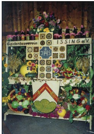
Dank für ein ertragreiches Gartenjahr: Der Erntedank-Altar.

prägen Informationsfahrten, die Bergmesse und ähnliche Ausflüge. Im September und Oktober kann man in der Mosterei des Gartenbauvereins Obst pressen lassen, wenn gewünscht sogar inklusive Destillation und Abfüllung. Der Herbst kündigt sich dann mit dem Steckkurs für Grabgestecke im Oktober an. Das Gartenvereinsjahr endet mit den Bastelabenden für die Advents- und Weihnachtsdekoration.