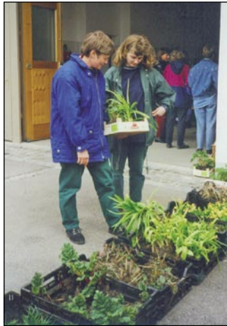
Beliebter Treffpunkt im April: Der Pflanztauschmarkt.

Im Sommer zieht es die Vereinsmitglieder in die Ferne: Diese Jahreszeit